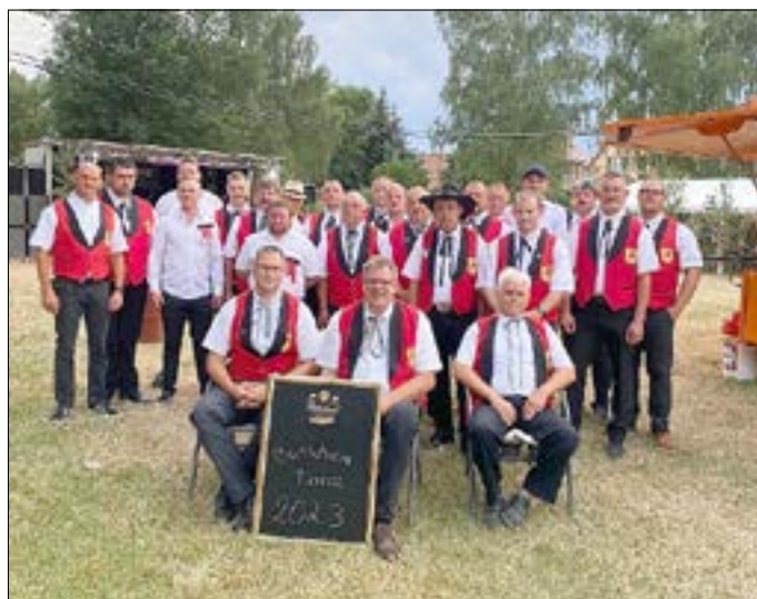
Nienstedter Burschen vereint im Pelzkocherverein 2023