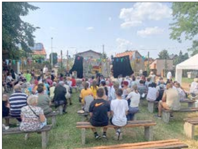
In Winkel ist zumindest 1mal im Jahr Theater.