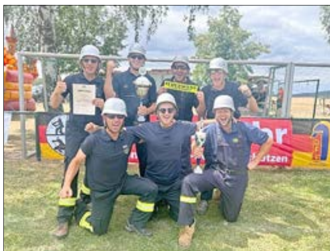
Zum 3. Mal in Folge Kreispokalsieger – die FFW Liedersdorf.