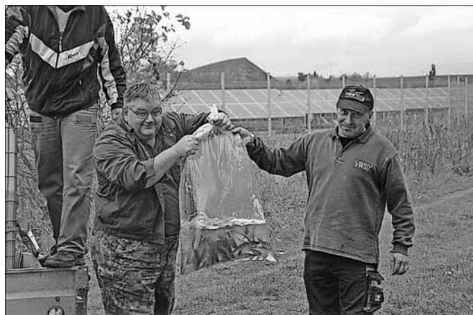
Am Vorwerksteich angekommen ging es gleich zur Sache. Im Wasser gefüllten Plastbeutel sind kleine Zander, die den Teichbesatz erweitern sollen.

Am 18. Oktober 2013 war es wieder mal so weit, Allstedts Angelsportfreunde konnten Karpfen in den Vorwerksteich und in der Katharinenriether Kiesgrube einlassen. Im Vorwerksteich wurden zirka 30 kleine Zander eingesetzt.