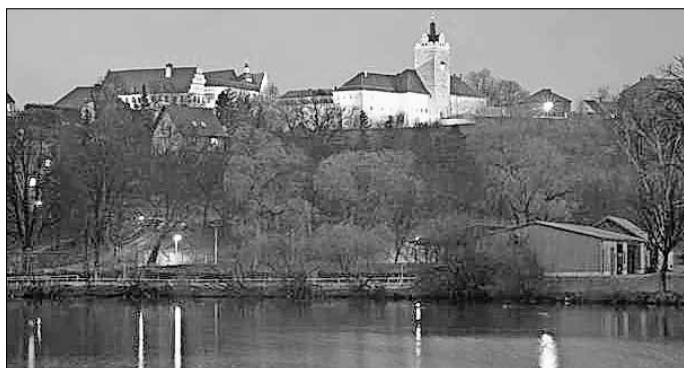
Das abendlich angestrahlte Schloss vom Teich aus

Zusammen mit der vom Rotary-Club Osnabrück-Süd gestifteten Beleuchtungsanlage und eingerechneten Spenden wurden der Stadt Allstedt damit Kosten von umgerechnet etwa 30.000 Euro erspart, welche sie vermutlich selbst kaum hätte aufbringen können.