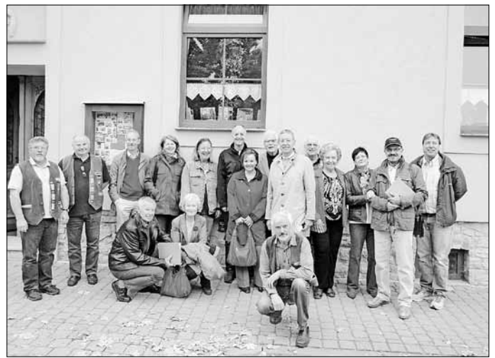
die Teilnehmer des Kayserschen Familientreffens vor dem Allstedter Heimathaus