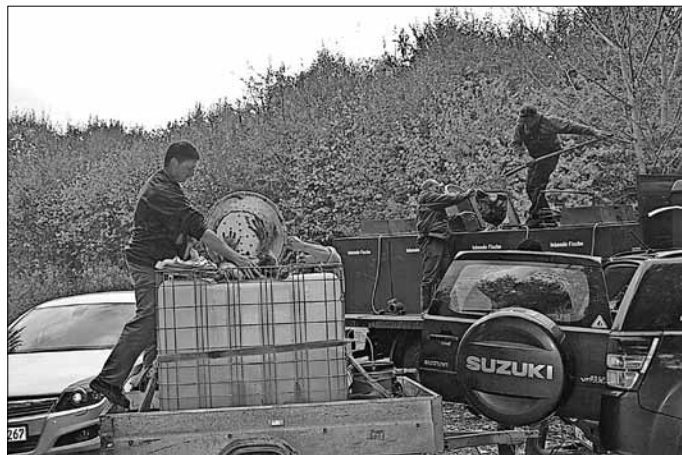
Auf dem Foto, links Angelsportfreund Rene Kokoska am Tank wo der neue Besatz zum Transport eingelassen wird.

Der Allstedter Angelsportverein konnte wieder neuen Fischbesatz holen.