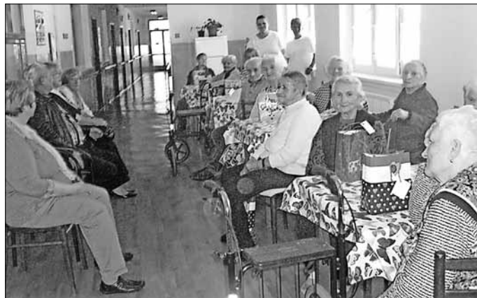
Im Wandelgang des Altenheimes Krakovany (Slowakei)

Im Rahmen dieser Veranstaltung erinnerte Freundin Friedrich an die Aktion „Weihnachten im Schuhkarton“, an welcher sich die Ortsgruppe Allstedt der Volkssolidarität in diesem Jahr ebenfalls beteiligt, so auch über die Umsetzung der gestellten Aufgaben. Eines dieser dieser Aufgaben war 2002 der abgeschlossene Freundschaftsvertrag mit einem Altenheim in Krakovany, in der Nähe unserer Partnerstadt Vrbové in der Slowakei. Im Oktober reisten wieder einige Freundinnen im Rahmen der städtepartnerschaftlichen Beziehungen mit nach Vrbové und besuchten auch das Altenheim in Krakovany.