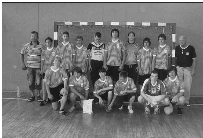
Das Archivfoto zeigt das Team der B-Jugend beim Sommerturnier in Allstedt.