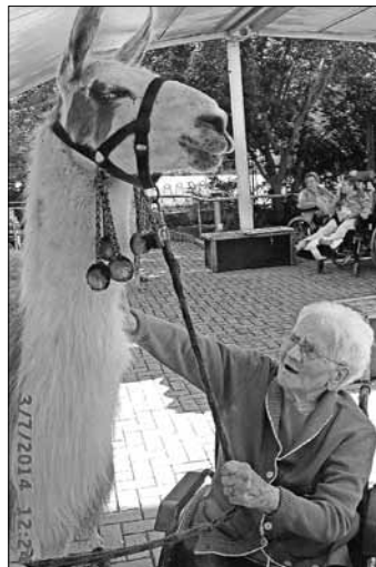
Das Lama liess sich streicheln und herumführen.

Das war wieder mal eine Überraschung für die Bewohner des Allstedter Pflege- und Betreuungszentrums am Donnerstag, dem 3. Juli 2014. Tierischer Besuch hatte sich eingestellt.