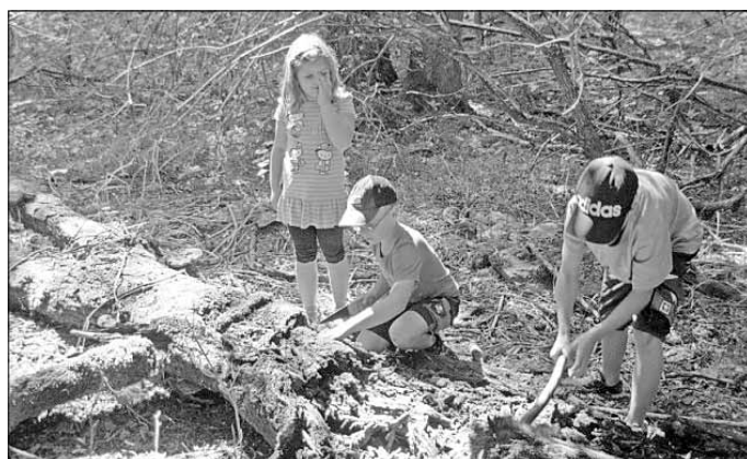
Auf Entdeckungstour im Wald

Mal sehen was wir noch in der Ferienzeit Schönes im Hort erleben. Auf alle Fälle werden wir davon berichten.