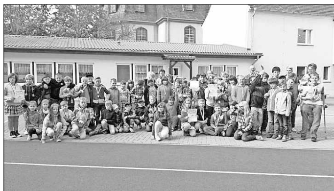
Sieger der Grundschule Allstedt