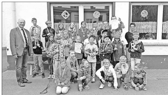
Sieger der Grundschule Holdenstedt

Nachdem die Siegerehrung am Vorabend des 1. Mai witterungsbedingt abgebrochen werden musste, wurden die noch ausstehenden Pokale, Medaillen und Urkunden in den Grundschulen feierlich übergeben.