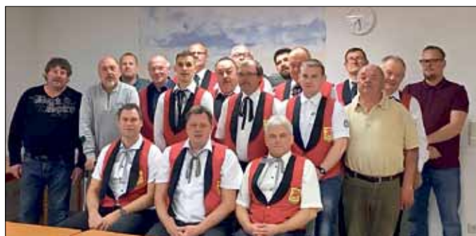
Ein starker Partner in Sachen Gemeindeleben in Nienstedt – Die Pelzkocher zu Jahreshauptversammlung