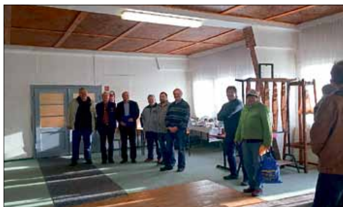
Nachgetragen: RKZV Allstedt zur Schaueröffnung