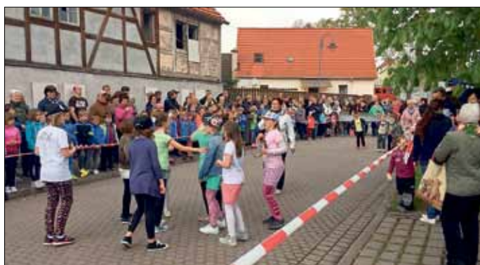
Wir machen Programm zum Staffellauf – Grundschule Allstedt