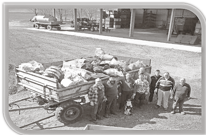
Der Pelzkocherverein Nienstedt e. V.

Am 18.04.2015 starteten 10 Pelzkocher Vereinsmitglieder in die Nienstedter Flur und sammelten den Unrat an Wegrändern und bestimmten illegalen Müllablageplätzen in der Gemarkung Nienstedt ein. Die Aktion dauerte 4 h und soll im nächsten Jahr wiederholt werden. Am Ende war ein Hänger (HW 60) voll mit Müll der später durch den Landkreis entsorgt wurde. Besonders aufgefallen ist, dass die illegalen Entsorger Biomüll in Säcken und Bauschutt wegwarfen. Nicht einmal 2 Tage nach der Aktion wurde schon wieder am Schacht Nienstedt illegal Müll entsorgt.