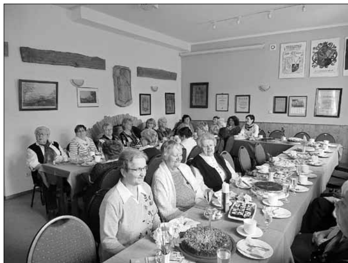
Gute Stimmung bei der traditionell Vereins-Frauentagsfeier am 08.03.2015

ckeren Fruchtbowlen kamen gut an und auch die von den Männern vorbereiteten Schnittchen wurden am späten Nachmittag noch gern verzehrt, bevor sich jede Frau mit einer schönen Rose in der Hand auf den Heimweg machte.