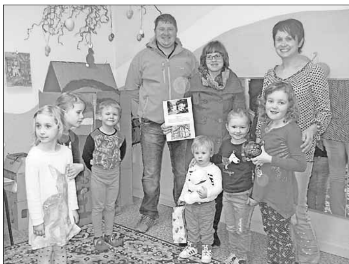
Das Team der Kita "Kreuzberg" in Allstedt

zusammen in unserer Gruppe diskutiert und Veränderungen gemeinsam beschlossen. Nur wer was macht, kann auch was ändern!! Wir sind dabei!