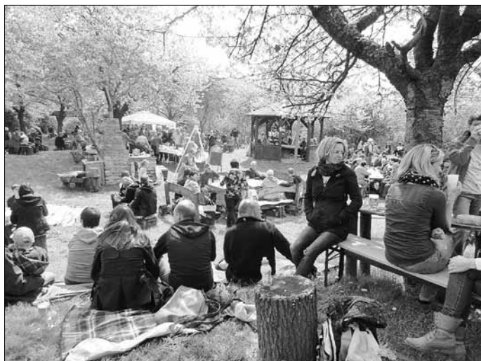
Sonnenschein und Volksfeststimmung am 1. Mai in den Kirschlöchern

Nahezu alle selbst gebackenen Kuchen und sonstige Speisen und Snacks wurden „an den Mann gebracht“. So haben sich Aufwand und Mühen der Vereinsmitglieder, Helfer und Sponsoren wieder einmal gelohnt, wurde den Allstedtern und Gästen doch erneut ein schönes Fest im Grünen beschert. Allen, die dazu beigetragen haben, sei auf diesem Wege nochmals herzlich gedankt!