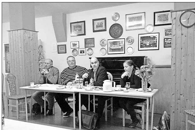
In Emseleh ging es im Bürgerforum mit dem Landrat hauptsächlich um die Grundschulproblematik.