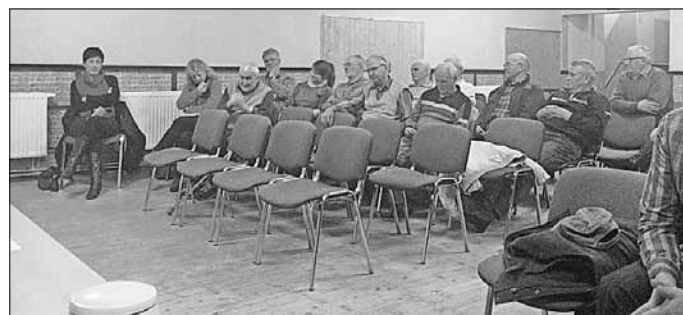
Zahlreiche Besucher waren gekommen um die Wasser- und Abwasserproblematik anzusprechen.