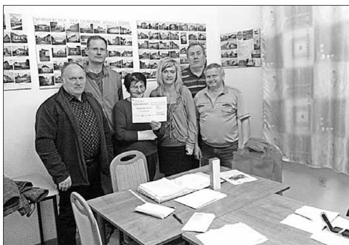
Der Ortschaftsrat Winkel durfte sich in seiner letzten Sitzung über einen kleinen Check aus dem Kalenderverkauf der Sparkasse Mansfeld-Südharz freuen. Das Geld soll für den Spielplatz verwendet werden, war einhelliger Tenor der Ortschaftsratsmitglieder.