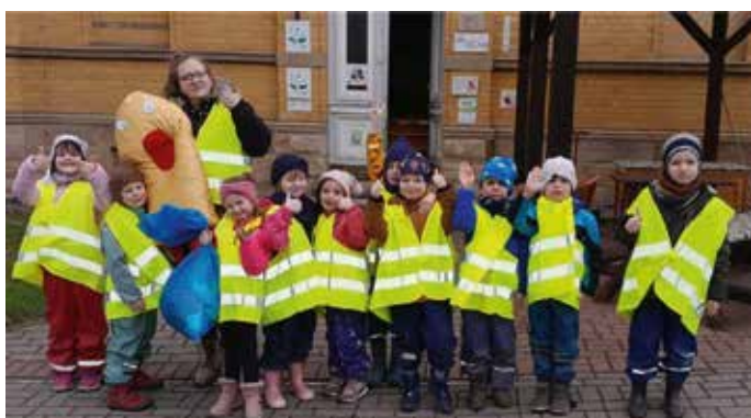
Das Team der AWO-Kita „Kreuzberg“

Aus diesem Grund bittet die Eichhörnchen-Gruppe der AWO- Kita „Kreuzberg“, die Bewohner aus der Region Allstedt, mehr auf die Umwelt zu achten.