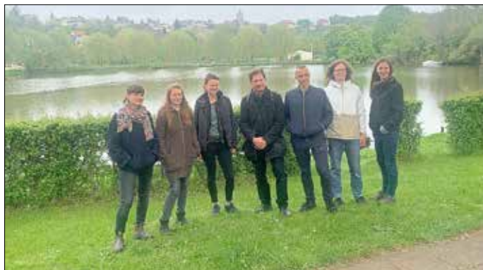
Junge Künstler wollen Kunstgeschichte schreiben in Allstedt