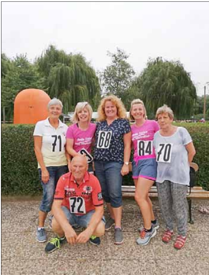
Benefizlauf im Sommerbad. So sieht Begeisterung aus.