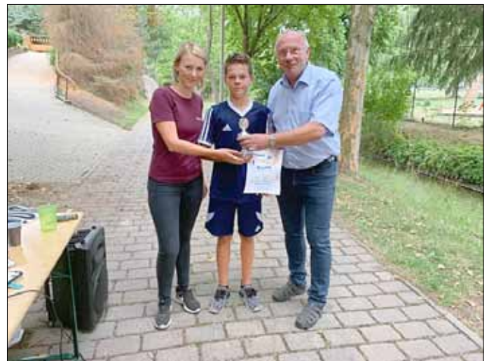
Und so der Sieger aus Hettstedt beim Benefizlauf! Klasse gemacht!