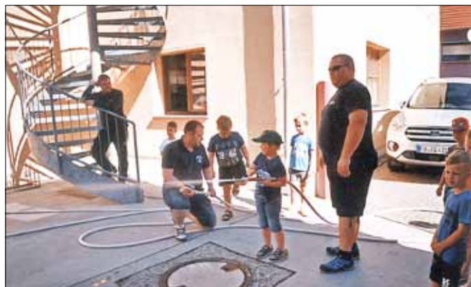
Zwei Kameraden geben Hilfestellung beim Zielspritzen. Die anderen beiden Gruppen durchliefen die gleichen Stationen. Es war ein schöner Abschluss der Kinder ihrer Kita-Zeit.

Text: hajoli, nach Informationen der Wehrleitung