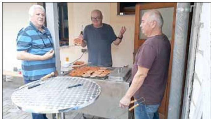
Unsere Grillmeister von der AG Geschichte in Aktion