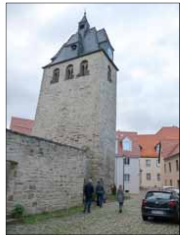
„Wigbertikirche (DOM) Allstedt