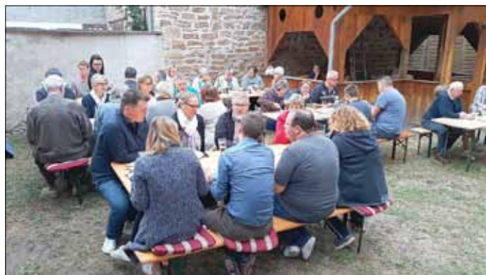
Gesellige Runden beim diesjährigen Grillfest im Vereinshof Am Schild