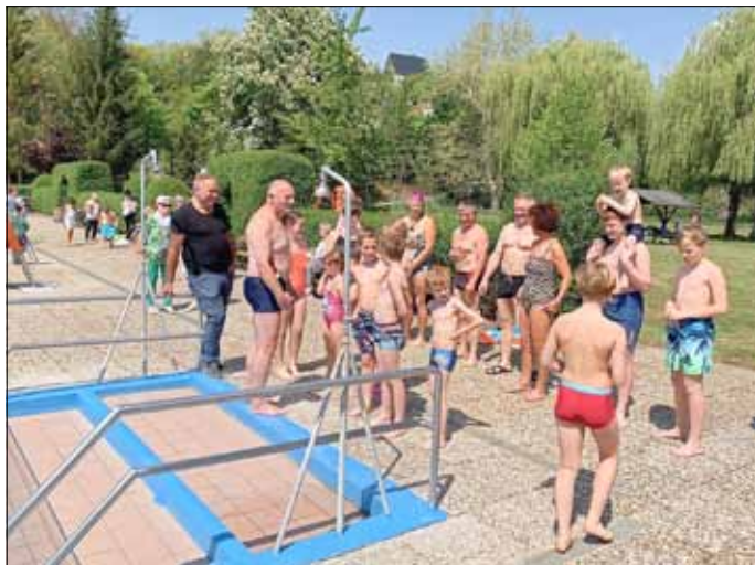
Auf eine gute Badesaison!