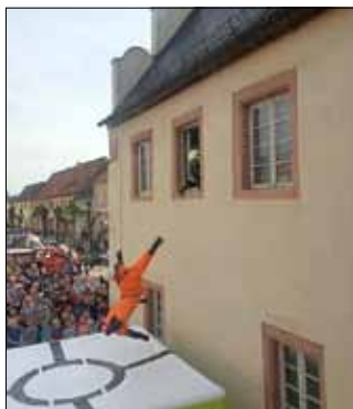
Der Dummie! Stellvertretend für den BM