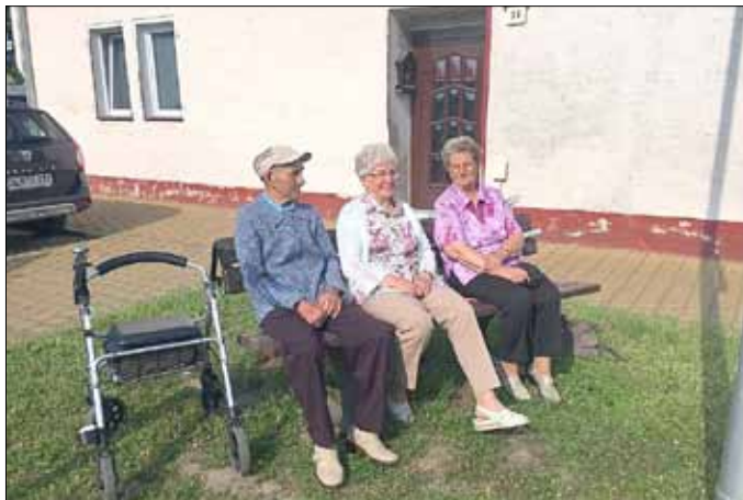
Wir warten schon – mit Blick bis zum Markt!