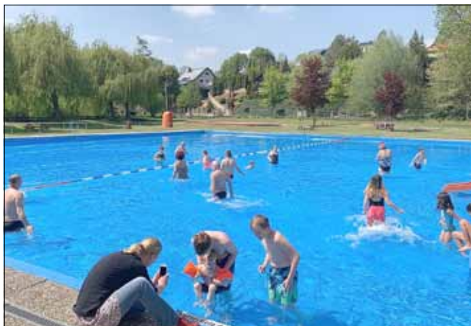
Auch die Jüngsten sind relativ begeistert über die Temperatur.