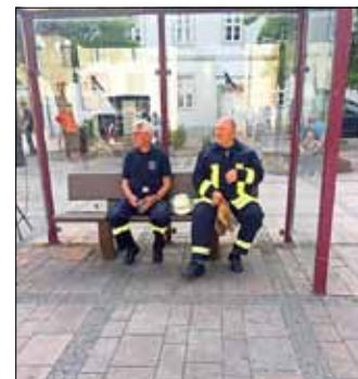
Heute fährt kein Bus nach Winkel. Nö – aber dafür die FFW üben Markt.