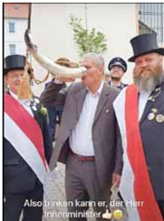
Also trinken kann er, der Herr Innenminister 🍷👍