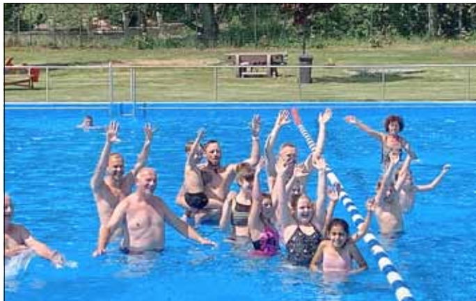
Erfolgreich gemeistert bei gefühlten minus/plus Graden.