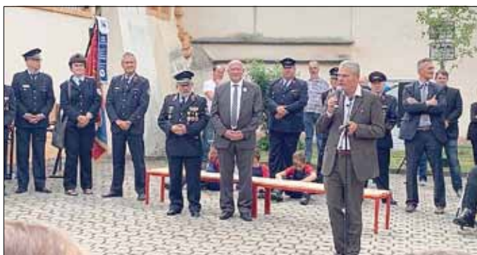
Der Innenminister gibt sich die Ehre - volksnah.