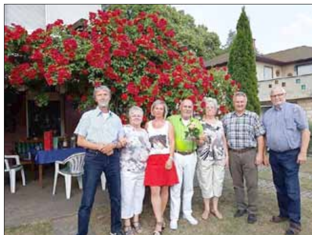
Der Jubilar im Kreise der Gratulanten vom Heimatverein Allstedt und der Stadtratsfraktion SPD/WG FFW

Aus diesem Anlass gratulierten Verein und Vorstand dem stets engagierten Jubilar im Rahmen einer kleinen Abordnung recht herzlich.