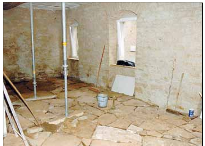
Ein rustikaler Fußboden wurde eingebracht.

Ein Fußboden aus unregelmäßigen Sandsteinplatten wurde eingebracht, Wände und Decken dem alten Gebäude entsprechend saniert, die Deckenstütze erneuert, Fenster vergrößert, rustikale Tische und Bänke angefertigt und eingebaut und eine neue Elektrik installiert.