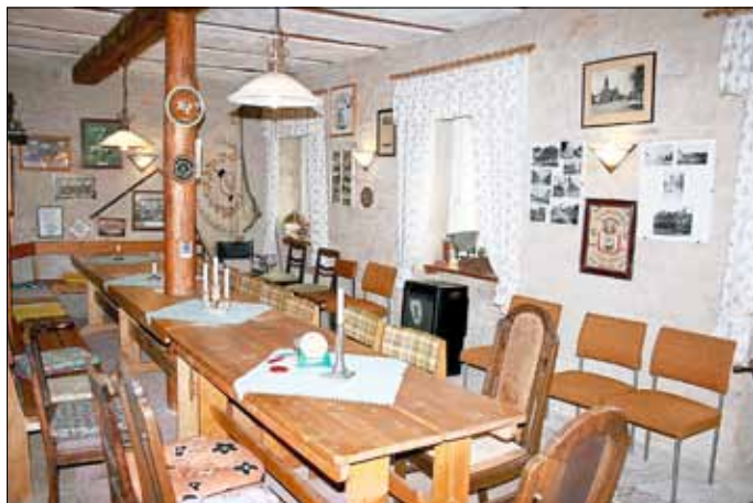
Blick in die fertig gestellte Heimatstube

Stühle und zum ländlich-rustikalen Gesamteindruck passende alte Ausstattungsgegenstände und Möbel wurden von Vereinsmitgliedern und heimatverbundenen Einwohnern gestiftet. Von 1998 bis zum Frühjahr 2003 war die gemütliche Heimatstube der passende Ort für unsere Vereinszusammenkünfte und Veranstaltungen.