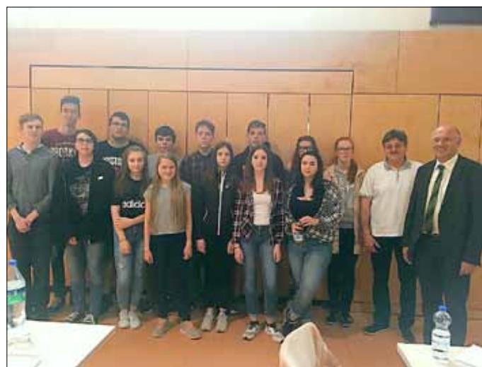
Allstedter Sekundarschüler beim Jugendkreistag

Wir wünschen allen Jubilarinnen und Jubilaren von Allstedt alles Gute zum Geburtstag und persönliches Wohlergehen