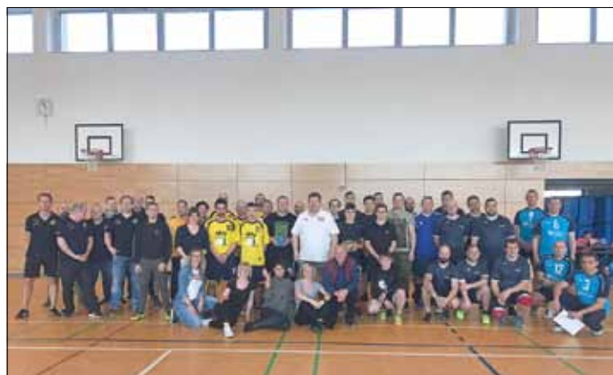
Super Handballturnier mit den 6 Freizeitmannschaften.