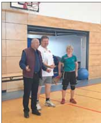
Eröffnung und Begrüßung der Bürgermeister mit den Ausrichtern.

Zumindest in Allstedt lag nach dem Sturm alles verstreut auf den Straßen. Es ist auch ein großes Ärgernis. Wie dem Beizukommen ist, beweisen so manche Haushalte. Nach meinen Recherchen haben Sie sich selber um eine gelbe Tonne im Internet bemüht und sich eine Tonne zu gelegt. Das finde ich absolut Nachahmenswert.