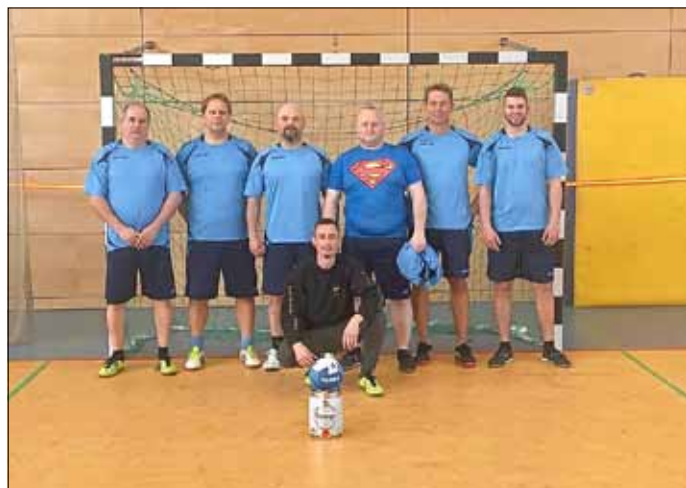
Sieger des Handballturniers – Die Boaca Juniors Allstedt.