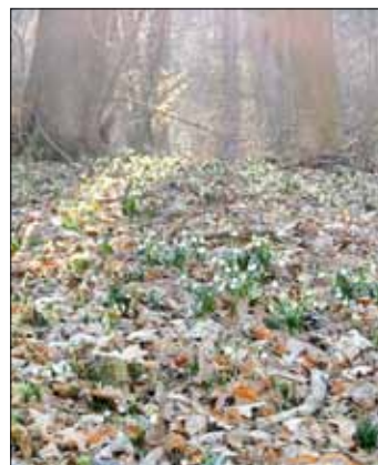
Alljährliche Blütenpracht im Naturschutzgebiet Märzenbechertal

Festes Schuhwerk, der Witterung entsprechende Kleidung und leichte Rucksackverpflegung werden empfohlen. Die einfache Wanderstrecke beträgt ca. 8 - 10 km, für Vereinsmitglieder und Wanderfreunde, die nicht mehr so gut zu Fuß sind, wird die Rückfahrt im Kleinbus organisiert. Für deftige Mittagsverpflegung vom Grill sowie kalte und warme Getränke sorgt in bewährter Weise Familie Hölzel am bekannten Standort.