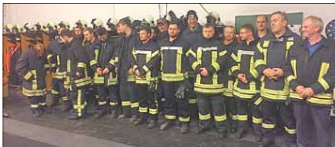
Ein starke Truppe Mittelhausen und Winkel nicht nur für den ABC-Einsatz.

Aufregender war die Informationsveranstaltung des Wasserverbandes zur zukünftigen Beitragserhebung im Gebührengebiet. Einige Ortsbürgermeister und Ortschaftsräte haben es sich nicht nehmen lassen, mit mir den Termin wahrzunehmen. Was wir hören mussten, ist besorgniserregend und sehr kritisch. Für mich absolut sozialpolitischer Sprengstoff, wieder Beitragserhöhungen in allen Gebührengeländen aufzugreifen. Ich bin gespannt, wie das Thema weiter behandelt wird. Jedenfalls ist das richterliche Urteil eine schwere Hürde. Ich bleibe dran am Thema und werde wiederholt berichten.