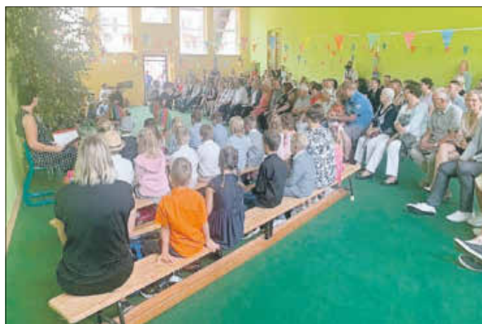
Einschulung eine bunte Welt für sich.

Gut erholt aus dem Urlaub und aus den Ferien? Ja schon, das Angenehme könnte immer etwas länger gehen. Wir sind zurück im Alltag und die Alltagsprobleme stapeln sich sofort. Was im Moment am Energiesektor passiert, macht die Erholung zu Nichte und treibt Sorgenfalten. Natürlich wollen auch wir in der Kommune gegen steuern. Doch die Steuerungselemente reichen nicht aus um die Preisspierele abzufangen. Beleuchtung minimieren, Heizkurven senken, warmes Wasser wird Luxus usw. Kein Gedanke mehr an schöne Urlaubsmomente. Doch dabei war ich einmal quer durch die Slowakei touristisch unterwegs, was zu empfehlen ist.