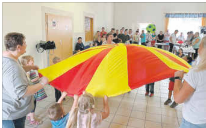
Die großen und kleinen Rohne-Racker