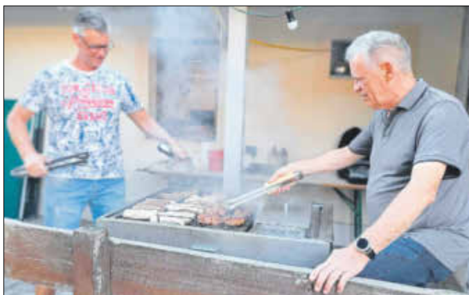
Unsere Grillmeister in Aktion