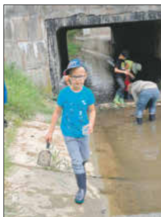
Auch in der Rohne wurde eifrig gekeschert