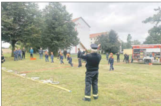
Auf die Plätze fertig und los. Die Kinderfeuerwehr am Start.

Somit schloss sich der Kreis vom Beginn der Planungen in 2017, bis hin zur Übergabe.