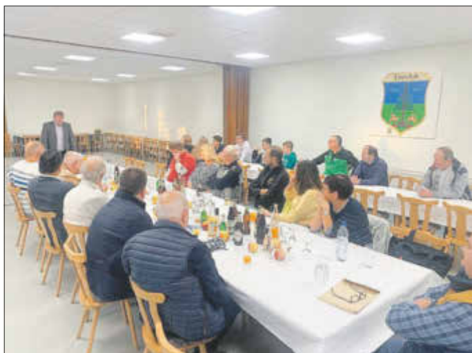
Die Mehrzweckhalle endlich saniert