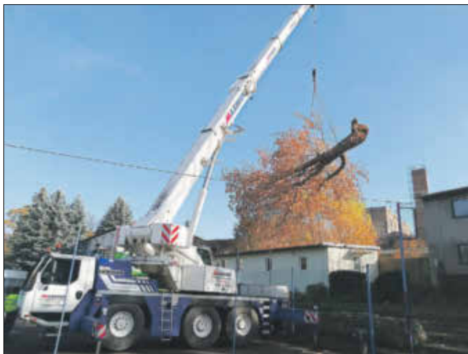
Die Bergung mittels Kran um weiteren Schaden zu vermeiden