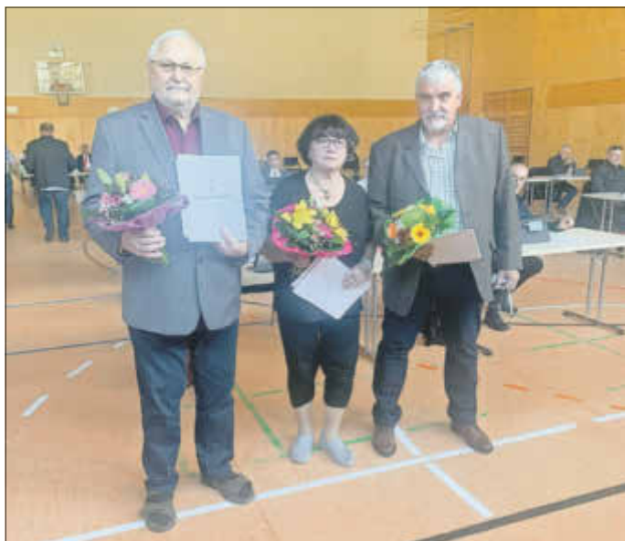
Urkunde und Prämie für Sotterhausen, Nienstedt/Einzingen und Beyernaumburg