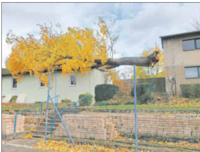
Ordentlich abgelegt vom Sturm

Baum auf Straße, Baum auf Auto, Baum auf Dach und so weiter. Der Sturm neulich hatte es wirklich in sich. Auf die Presseanfrage ob Allstedt die Kernzone war, musste ich ein wenig in mich gehen. Ein gefühltes „ja aber“ war dann schon zu hören. Der Vormittag hatte es besonders in sich und die Lage war nicht mehr einzuschätzen, außer wir belassen an dem Tag die FFW-Einsatztruppe dauerhaft im Gerätehaus. Das Schadensbild war schon weitreichend. Baum auf Auto ist ja doch meist mit dem Totalschaden verbunden.